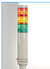
Torre de Alarme